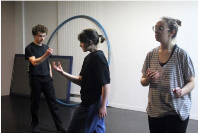
Huit élèves formés à l'institut national du music-hall, au Mans (Sarthe), vont se produire dans deux spectacles de Terra Botanica, à Angers.

Pour sa saison 2025, le parc Terra Botanica propose deux nouveaux spectacles, auxquels participent huit élèves de l'institut national du music-hall du Mans (Sarthe).