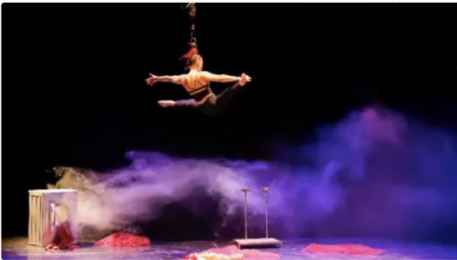
Magie et poésie au service de l'artistique - INM

Si vous aimez le spectacle vivant, les strass et les paillettes, alors la fièvre du music-hall vous a gagnée ! Et ça tombe bien puisque la Sarthe possède un vrai savoir-faire en la matière, qui s'exporte et innove.