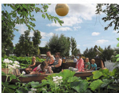
Le parc Terra Botanica rouvrira ses portes le 5 avril.

Fort de ses 587 000 visiteurs en 2024, le parc d'attractions Terra Botanica s'apprête à rouvrir ses portes, le 5 avril, avec quelques nouveautés au programme. Côté billets d'entrée, pas de grands bouleversements. Le ticket sur place restera proche des prix de l'an dernier, avec un billet adulte à 24,50 € et un billet enfant à 19 €. En revanche, pour obtenir un pass annuel - le pass saison - il faudra déboursier 15 € de plus que l'année dernière. À moins de renouveler son pass, auquel cas l'augmentation baisse à 10 €. Autre changement notable : fin de pass saison à enfler autour du cou. Ce dernier sera désormais matérialisé. Pour cette saison 2025, le parc du Grand Ouest mise sur une toute nouvelle attraction immersive, « Aventure au Bayou », inspiré des paysages de Louisiane. Une nouveauté qui s'accompagne d'un tournant stratégique : depuis le 1 er février, la gestion de Terra Botanica a été confiée au