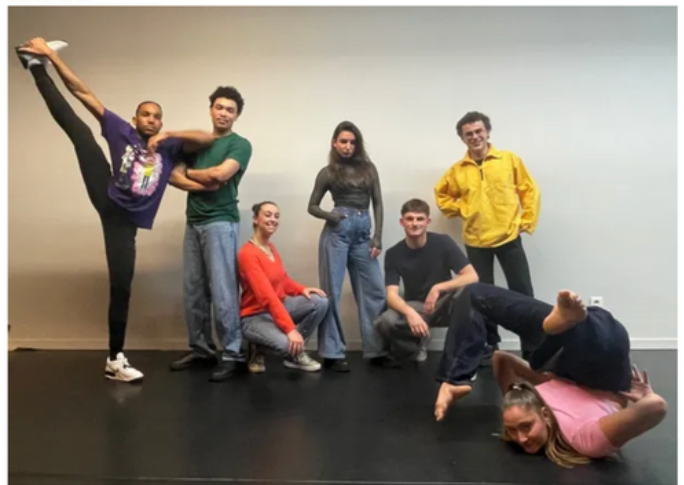
Plus que des élèves, des artistes - INM