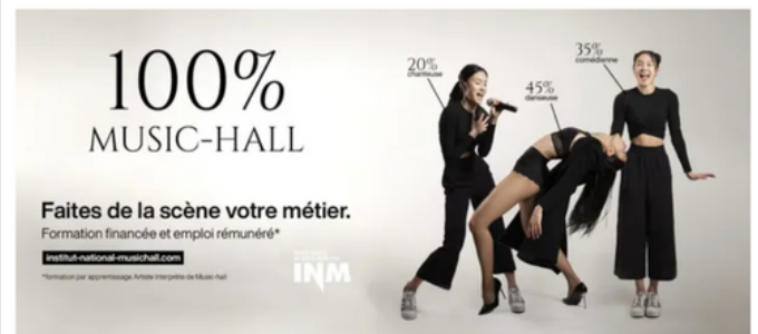
Ils vous veulent dans leur équipe ! - INM