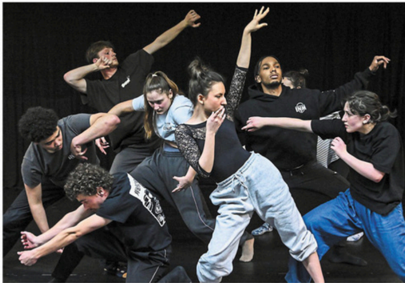
Huit artistes de l'Institut national des arts du music-hall ont signé un contrat d'apprentissage avec Terra Botanica.