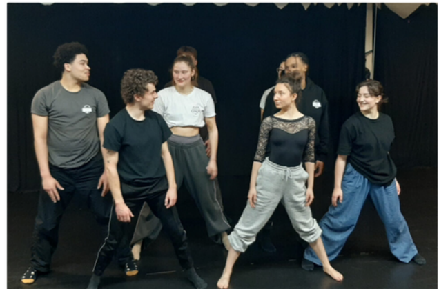
Huit élèves de l'institut national du music-hall (INM) au Mans (Sarthe) vont se produire dans deux spectacles de Terra Botanica.