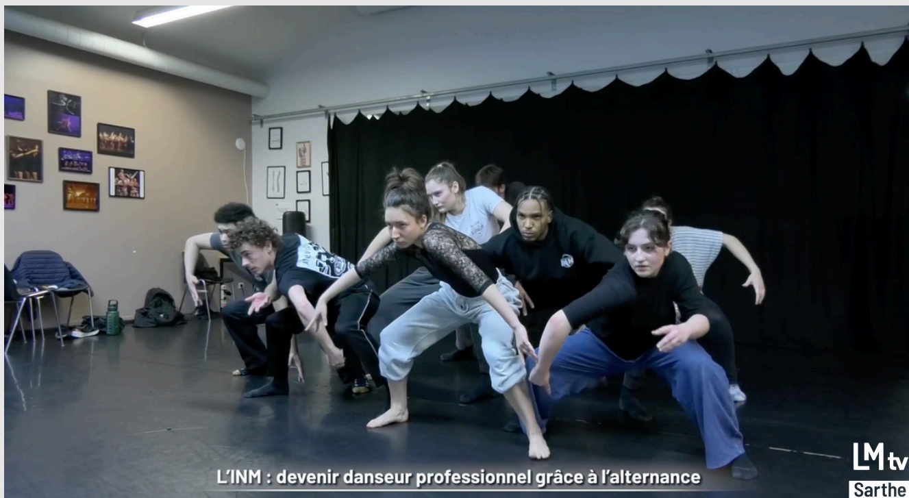
L'INM : devenir danseur professionnel grâce à l'alternance

Des étudiants danseurs en contrat d'apprentissage. C'est la particularité de l'Institut National du Music Hall. Mettre en lien les futurs professionnels du spectacle et des entreprises qui ont besoin d'artistes. En ce moment, 8 jeunes danseurs de l'institut sont en contrat d'apprentissage avec le premier parc européen consacré au végétal : Terra Botanica, à Angers.